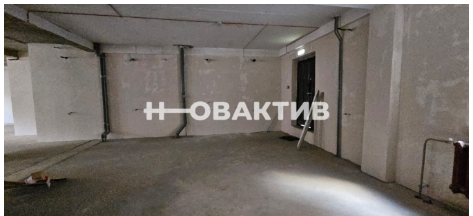
1подземный этаж 1 подъезд