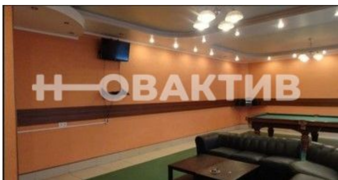
Баня «Большая баня»