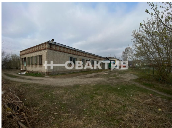
Google ул. 25 Партизана, 1