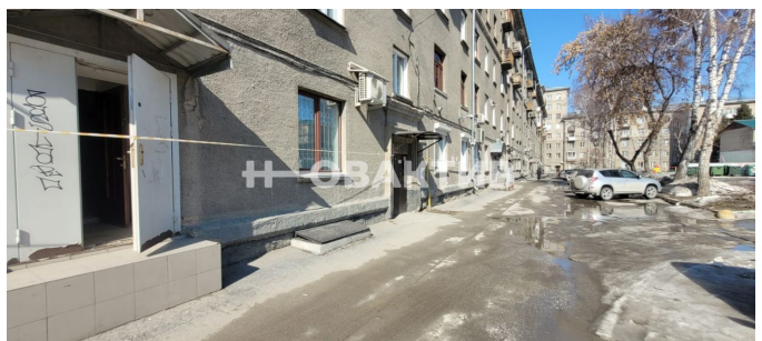
Фрагмент 1 этажа