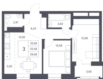
2-к.квартира, 61.88 м², 20 эт.